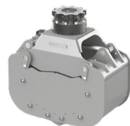
Option: anschraubbare Seitenwände