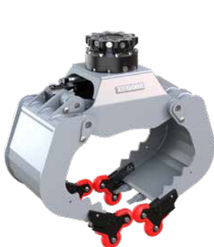
optionale 4-Grip Ansteckvorrichtung, hier angebaut an einem A09H